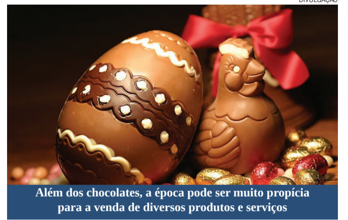
Além dos chocolates, a época pode ser muito propícia para a venda de diversos produtos e serviços

Como em anos anteriores, o período da Semana Santa (neste ano de 14 a 16 de abril), tem um aumento do fluxo de pessoas que colocam o pé na estrada, seja para passar a Páscoa com a família ou mesmo para descansar, aproveitando o feriado prolongado. Saiba como transformar os negócios ligados ao setor turismo em